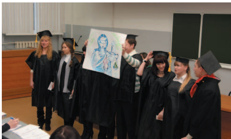
Представление команды 2 курса факультета права и экономики