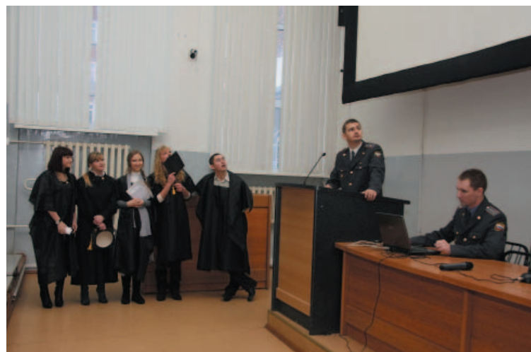
Что там у нас на экране?

Организаторы КВН-викторины не обошли стороной и болельщиков. Специально для них был подготовлен «Конкурс зрителей». Участие в проведенном мероприятии позволило курсантам и студентам продемонстрировать свои творческие способности, а также знание дисциплины «Правоохранительные органы». КВН-викторина проходила в теплой атмосфере, наполненной положительными эмоциями. Огромную моральную поддержку своим командам оказывали груп-