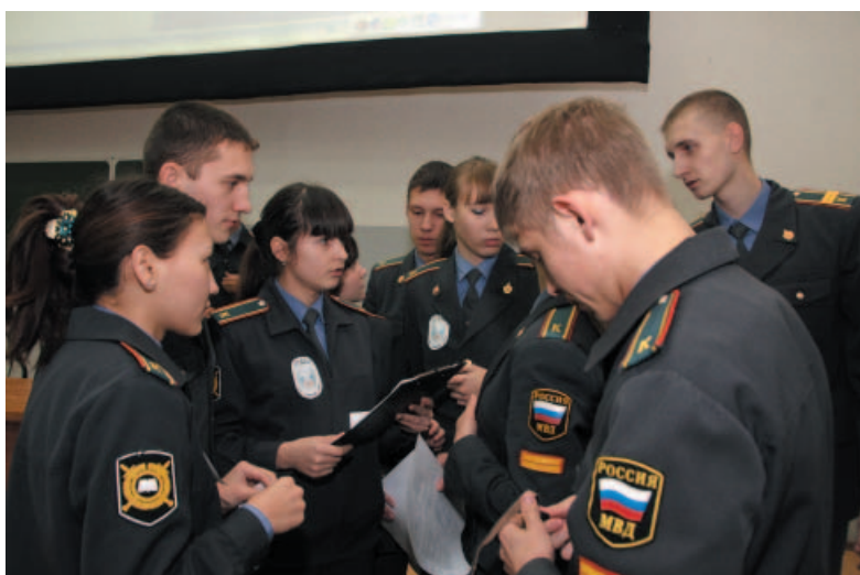
Обдумывание ответа командой «Отдел по шитию дел»

Участвуя в первом конкурсе КВН-викторины, команды выполнили приветствие и сообщили свое название. В результате на суд жюри были представлены команды с названиями «Отдел по шитию дел» (команда 2 курса следственного факультета, в со-