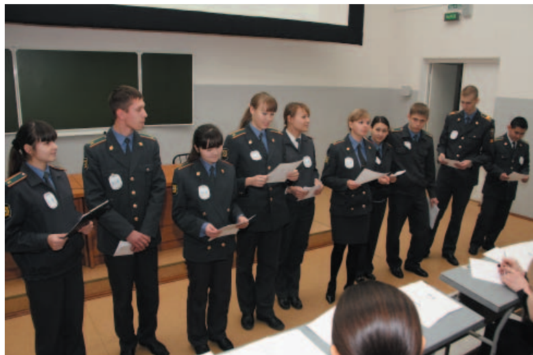
2 курс следственного факультета представляет свою команду

15 декабря 2009 года в лекционном зале № 1 Омской академии произошло одно из интереснейших событий в жизни курсантов и студентов нашего учебного заведения.