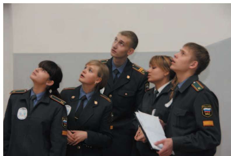
Какое интересное задание...

Серьезная подготовка к участию в КВН-викторине проявлялась не только в тех шутках, которые присутствующие слышали от участников команд, но и во внешнем виде. Так, сборная «Судейской бригады» имела свой отличитель-