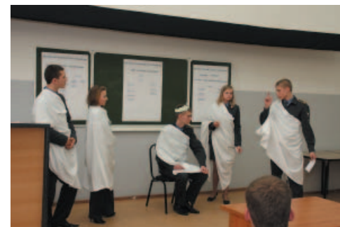
Разминка – Обмен любезностями