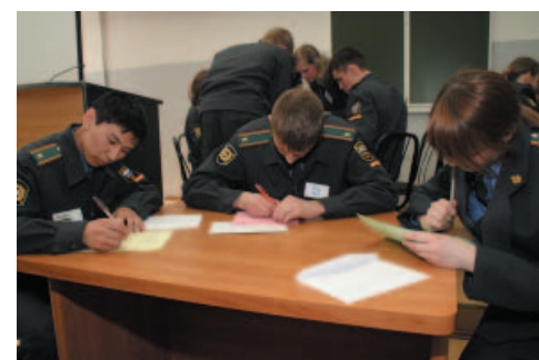
Конкурс капитанов – Эрудит-тест